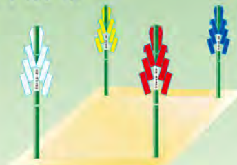
神社準備 (竹丈 1m弱)